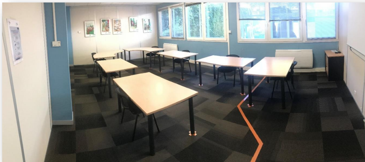
Salle de formation