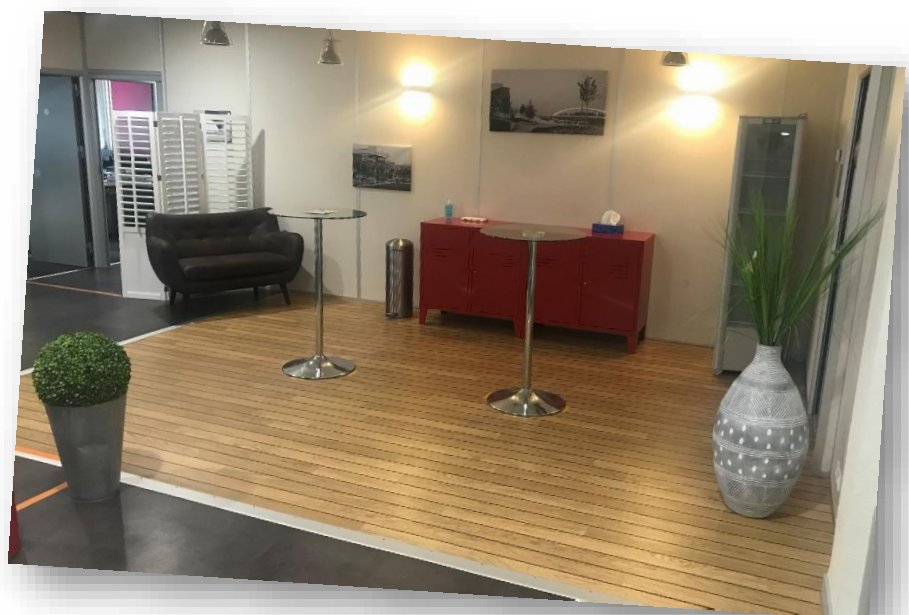
Lieu de pause